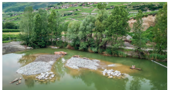
Figure 8 : Îlots au Nord-Ouest terminés avec vue sur les pierriers et les hauts fonds [31.05.2018]. Les bancs de galets sont hors des hautes eaux. Abbildung 8: Fertiggestellte Inselchen im Nordwesten mit Blick auf die Geröllhalden und Untiefen [31.05.2018]. Die Kieselsteinbänke liegen ausserhalb des Hochwassers.