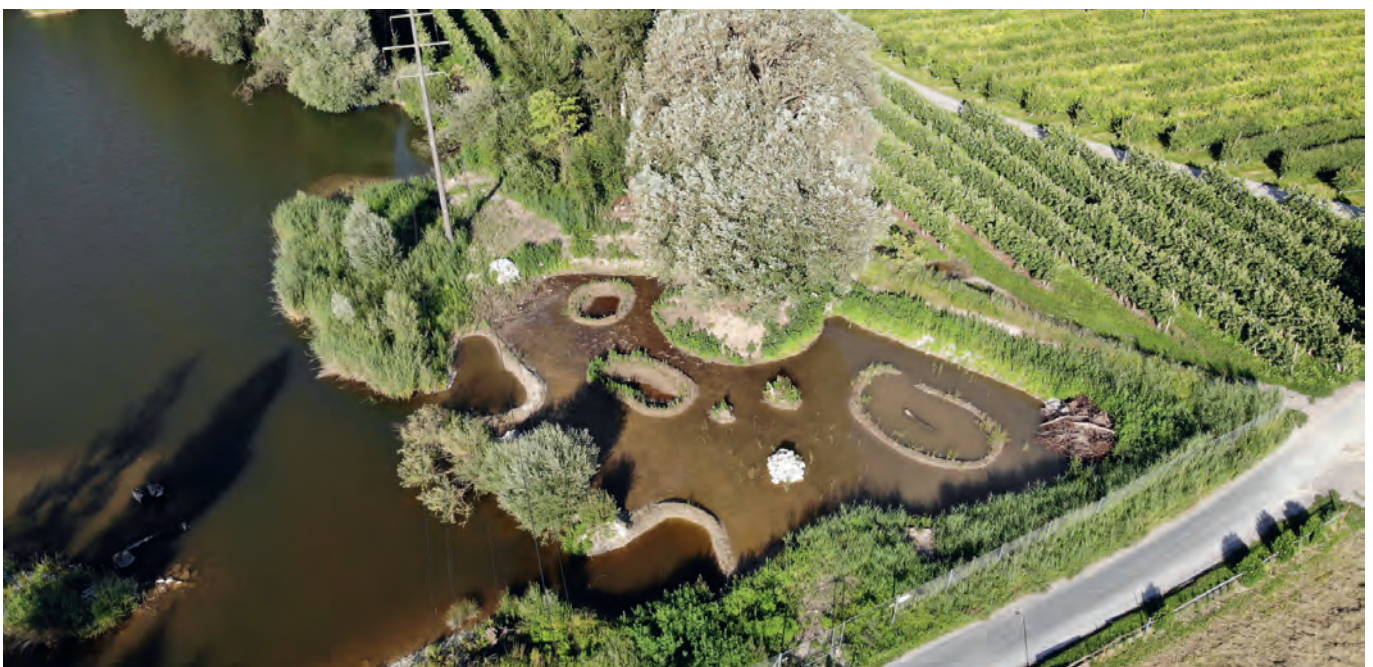
Figure 10: Phase 3, abgeschlossene Arbeiten am Südufer mit Schaffung von Untiefen, Wasserflächen, Geröllhalden und Totholzhaufen ausserhalb des Hochwassers, Drohnenansicht bei Hochwasser 05.07.2022

choix de matériaux de qualité irréprochable, un suivi de la qualité physico-chimique des eaux du lac, une étude piézométrique et de la pose d'un rideau immergé. A cela s'ajoutent des campagnes de pêches de sauvetage qui ont