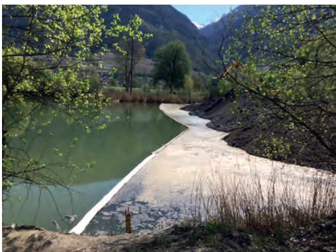
Figure 4 : Effet positif de rétention des particules fines du filet de protection [20.04.2018] Abbildung 4: Positiver Rückhalteeffekt des Schutznetzes für Feinpartikel [20.04.2018]