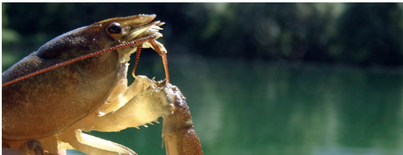
Figure 2 : Ecrevisse à pattes blanches [26.06.2015] Abbildung 2: Steinkrebs [26.06.2015]