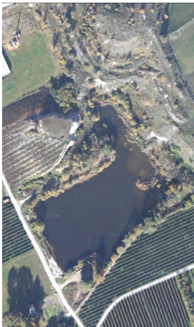
Figure 1 : Situation initiale du lac de Pramont avant travaux Abbildung 1: Ausgangssituation des Lac de Pramont vor den Bauarbeiten

Les enjeux de ce projet sont multiples entre la protection des valeurs écologiques existantes et l'utilisation de matériaux propres adaptés au milieu afin de maximiser la diversité d'habitats. Un important dispositif visant à limiter les impacts liés aux travaux, une évacuation des déchets conforme aux filières, ainsi que la gestion des risques de prolifération de néophytes envahissantes (renouée du Japon, robinier et solidage) furent mis en place avec succès. Ces enjeux ont été maîtrisés grâce à un processus de planification, de suivi des travaux et de contrôle des résultats méticuleux. Un diagnostic précis a ainsi pu être dressé, permettant de définir, grâce à des relevés bathymétriques, le volume de matériaux à immerger tout en