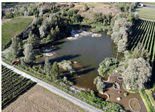
Figure 11: Travaux terminés avec création de hauts-fonds, plan d'eau, pierriers et tas de bois mort hors des hautes-eaux, vue de drone en hautes-eaux [05.07.2022]