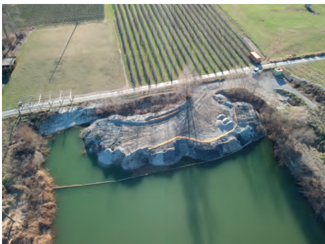
Figure 5 : Vue sur le tas de matériaux avant modelage final [vol de drone, drosera, 01.04.2018] Abbildung 5: Blick auf den Materialhaufen vor der endgültigen Modellierung [Drohnenflug, drosera, 01.04.2018]