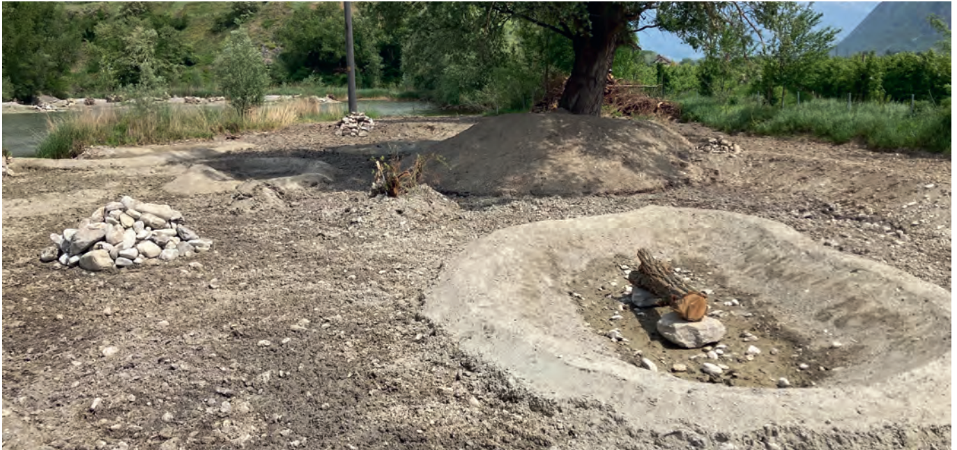
Figure 9: Phase 3, abgeschlossene Arbeiten am Südufer mit Schaffung von Untiefen, Wasserflächen, Geröllhalden und Totholzhaufen ausserhalb des Hochwassers [23.05.2022]