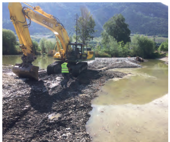
Figure 7 : Excavation du chenal de min 2m de profondeur entre les îlots et les rives [08.05.2018] Abbildung 7: Aushub der min. 2m tiefen Rinne zwischen den Inselchen und den Ufern [08.05.2018]