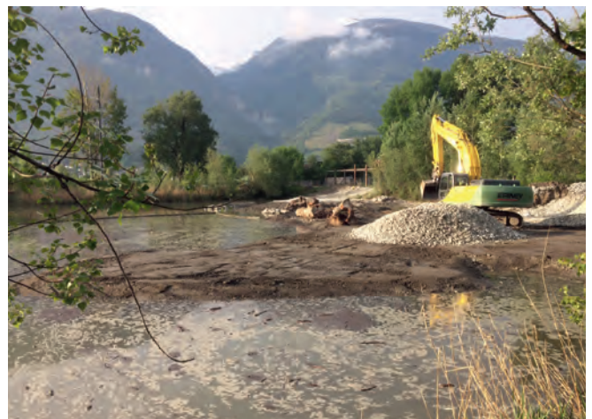
Figure 6 : Mise en place des bancs de graviers et des souches [04.05.2018] Abbildung 6: Einbringen der Kiesbänke und der Wurzelstöcke [04.05.2018]