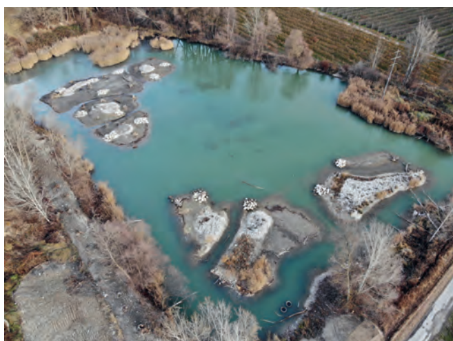
Figure 12: Vue aérienne des aménagements finis. En bas, les trois îlots graveleux réalisés en 2018. En haut à gauche, les 4 nouveaux îlots réalisés en 2021 Abbildung 12: Luftaufnahme der fertigen Anlagen. Unten die drei kiesigen Inselchen, die 2018 angelegt wurden. Oben links, die vier neuen Inselchen, die 2021 realisiert wurden

permis de transloquer les populations astacicoles déjà en place.