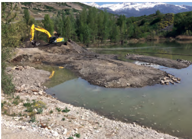
Figure 3 : Travaux de modelage des rives et des îlots [25.04.2018] Abbildung 3: Arbeiten zur Modellierung der Ufer und der Inselchen [25.04.2018]